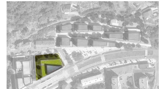
Photo chantier 06/19