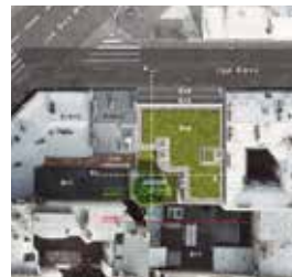
43-45 rue Davy

Démolition d'un foyer et reconstruction d'une résidence de jeunes travailleurs en deux immeubles distincts, situés aux deux extrémités de la rue Davy - 76 logements et locaux partagés.