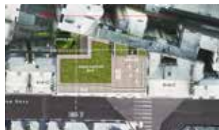
8-10 rue Davy

Plan climat de la ville de Paris - RT 2012 Effinergie + NF Habitat Démarche HQE niveau excellent